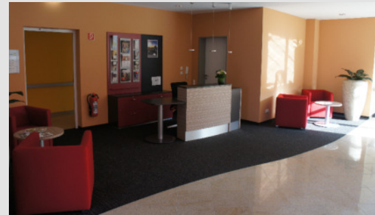
HAUS A - EMPFANG