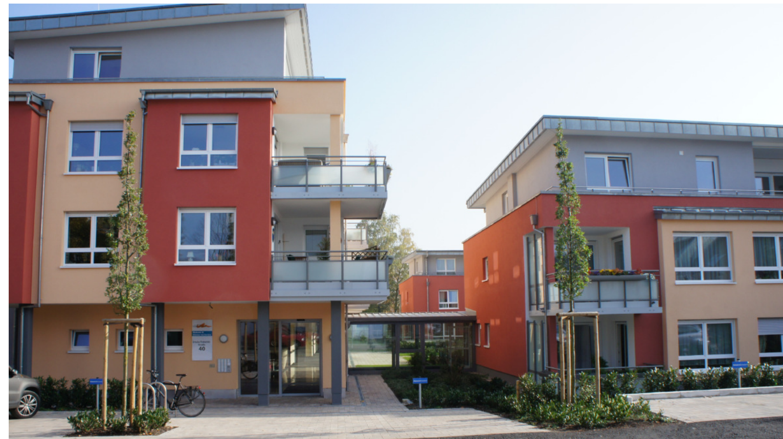
HAUPTTEINGANG HAUS A + D