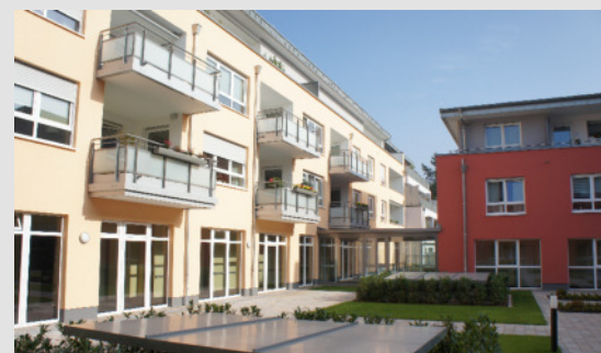
INNENHOF HAUS A + C