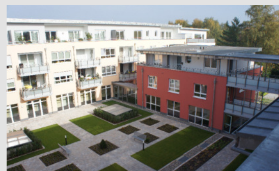
INNENHOF HAUS A + C